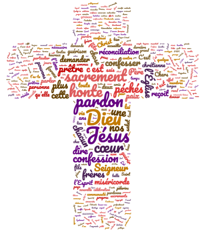
Nuage de mots réalisé à partir de la catéchèse du pape François du 19 février 2014 sur le sacrement de réconciliation.