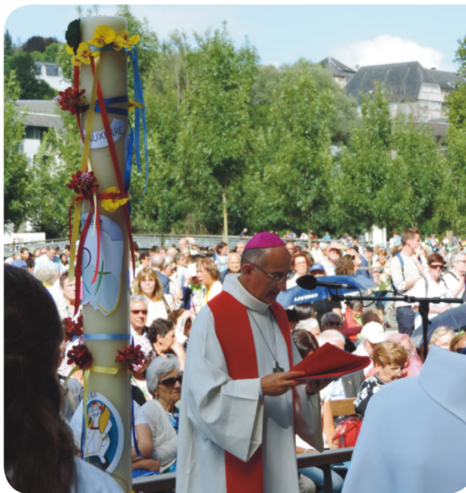
Bénédiction du cierge diocésain dans la grotte de Lourdes - 2016

Vous rejoindrez Lourdes par vos propres moyens le dimanche 27 août, chaque couple/famille arrivant à son rythme (à partir de 16 heures).