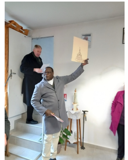
Présentation et envoi de l'équipe d'animation paroissiale