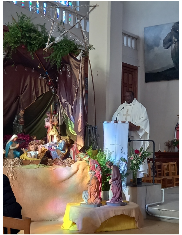
Épiphanie au Christ-Roi