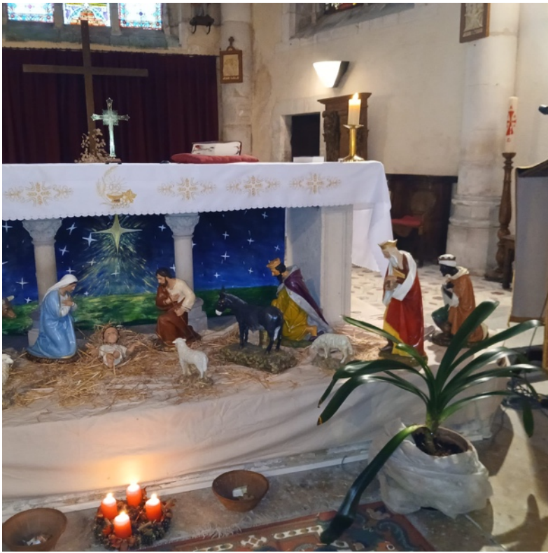
Épiphanie à Cheny