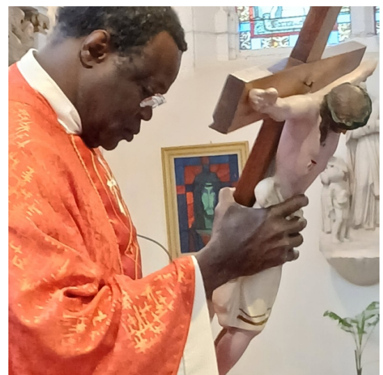
Vendredi Saint : office de la croix – Mont-Saint-Sulpice