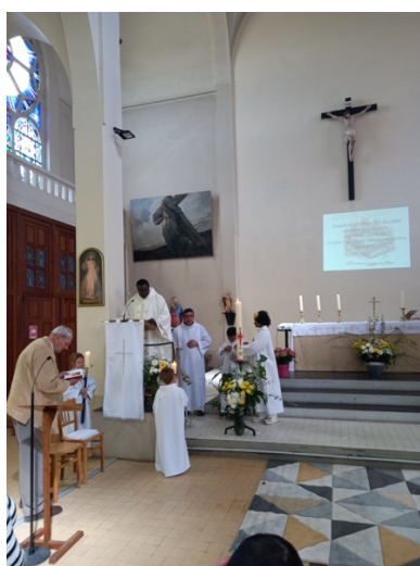
Dimanche de Pâques