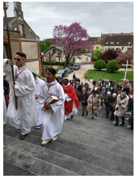
Dimanche des Rameaux (à Beaumont, au Christ-Roi)