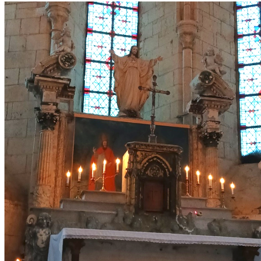
Messe à Bussy