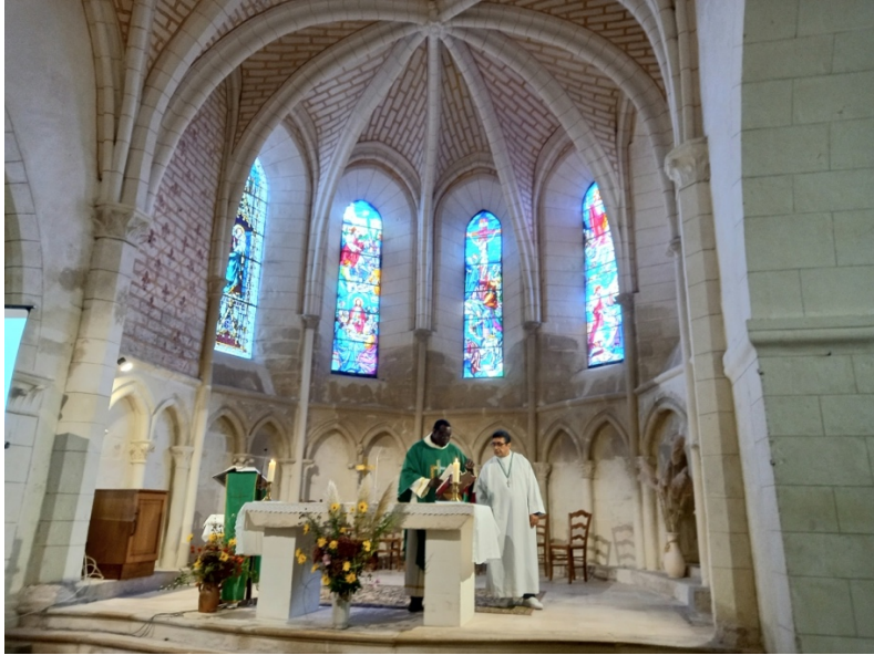
Messe à Saint-Pancrace