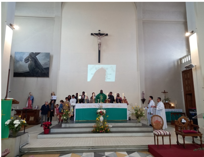
Messe des familles