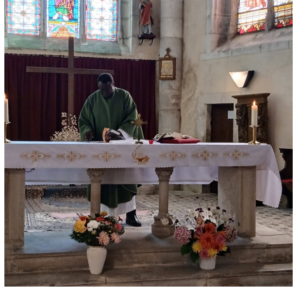
Messe à Cheny