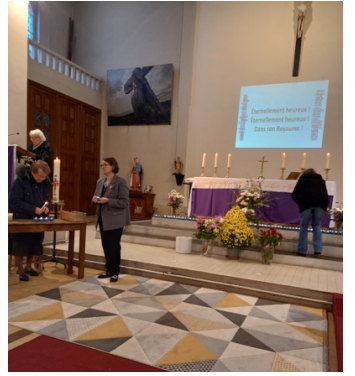
Messe du 2 novembre – Envoi des équipes obsèques