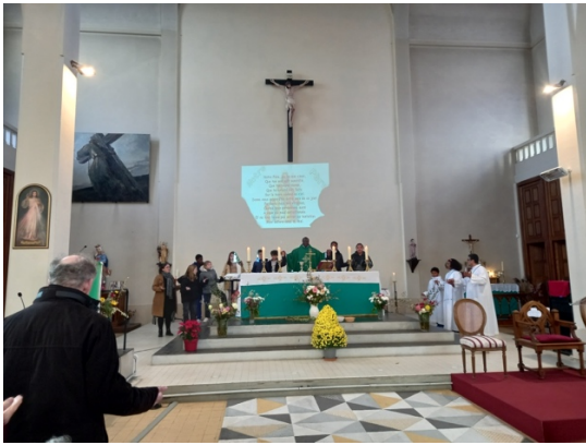
Messe des familles