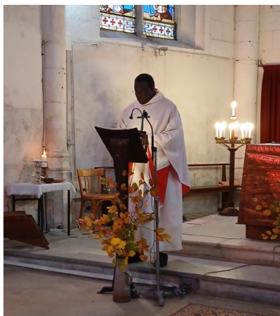
Messe à Ormoy