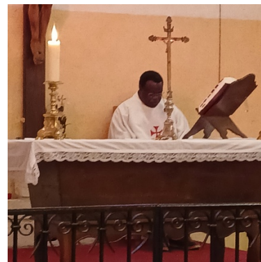
Messe à Charmoy