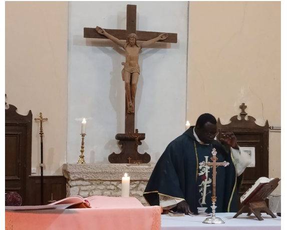
Messe à Épineau-les-Voves