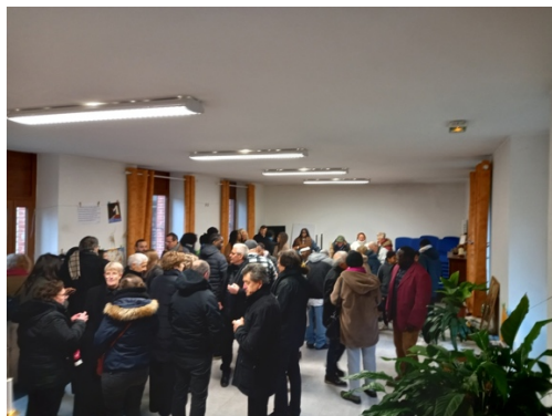
Fête du Christ-Roi, verre de l'amitié