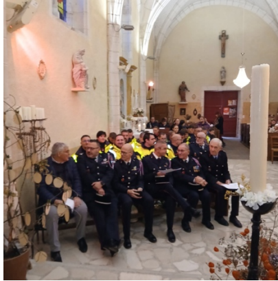
Sainte Barbe à Beaumont