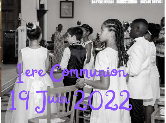
1ere Communion 19 Juin 2022