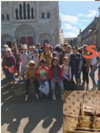
Sortie Catechisme Verzlay 25 Juin 2022