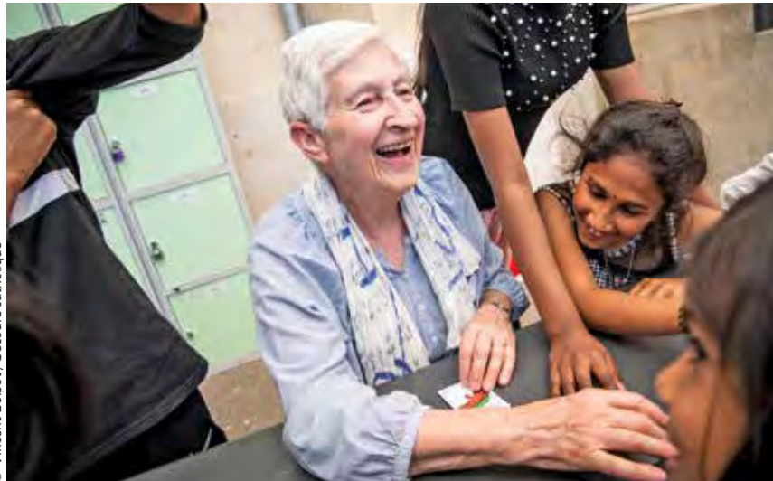
Une journée fraternelle organisée à Meaux par la délégation de Seine-et-Marne du Secours catholique - Caritas France, le dimanche 15 mai 2022.

« Je rêve d'une Église qui prend des risques, accueillant