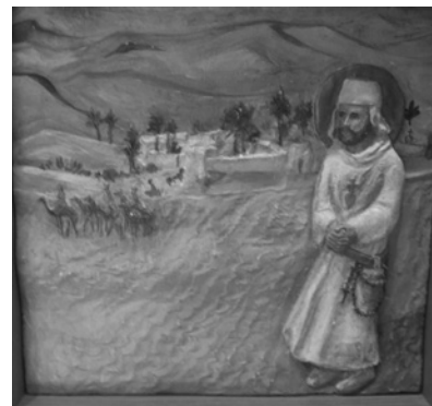
Détail du polyptique de Notre-Dame des Neiges

Après une jeunesse loin de Dieu, il a changé totalement de vie en rencontrant le Christ qui l'a attiré à Lui. Il en est venu à l'imitation du Christ, en se mettant à son école. Il vécut au Sahara, dans la pauvreté et le silence. Il se sentait le frère universel de tous. Il a montré l'importance de cultiver l'amitié et la fraternité avec ceux qui sont loin de nous, en utilisant le sourire comme une charité.