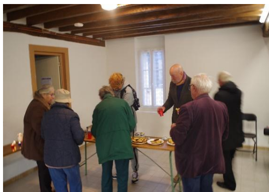
Boissons chaudes et gâteaux