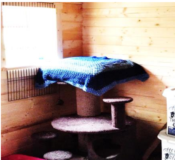
Nos couvertures sont installées pour les chatons.

Cet été, avec des pelotes de laines récupérées, des couvertures ont été faites. Notre animatrice a pris contact avec une association d'aide aux animaux ; Elle sait que venir en aide ou soutenir notre prochain est important pour nous.