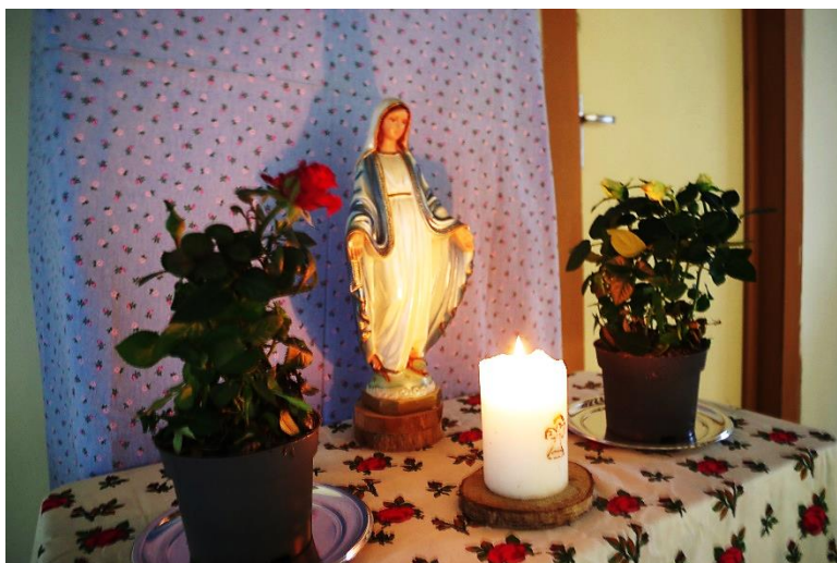
Veillée le 15 septembre : pour le mois du rosaire