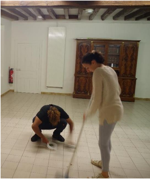
Nettoyage de la salle

Après certaines veillées, nous nous retrouvons pour un petit repas.