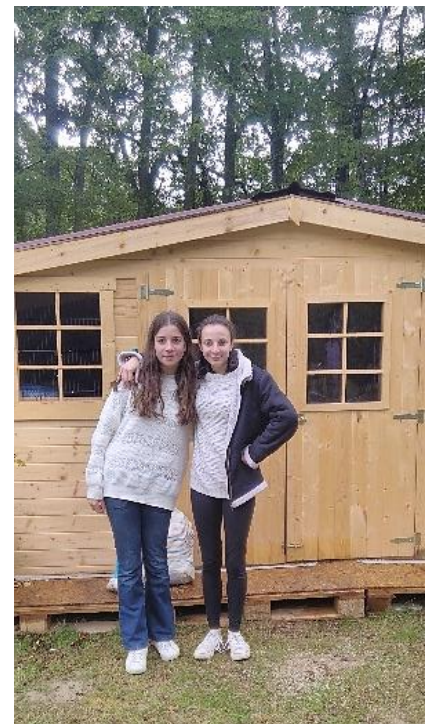
Devant le chalet des chats.